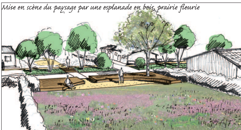
Mise en scène du paysage par une esplanade en bois, prairie fleurie