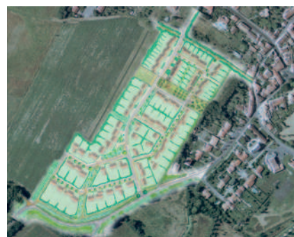
Un quartier connecté au centre-bourg

Un travail en finesse a ensuite été effectué sur la qualité des espaces publics notamment des espaces verts pour permettre de créer l'identité de ce nouveau quartier. L'ossature générale s'appuie sur des éléments comme la gestion des eaux de pluies (noues et bassin), l'utilisation d'une végétation locale permettant de renforcer la biodiversité et la mise en place d'espaces de vie (mise en scène vers le paysage extérieur, verger ornamental, zone de jeux, prairie fleurie) pour permettre de retrouver des éléments de centralité au sein de cette nouvelle zone urbaine.