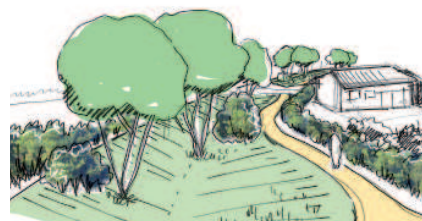
Noue, cépées et cheminement, un parcours de qualité à travers le quartier