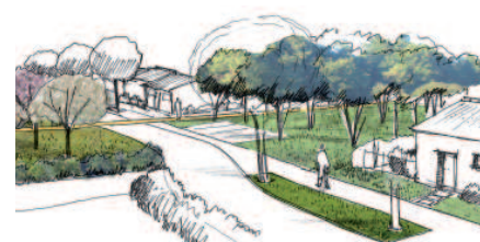
Verger, sous-bois, des ambiances diverses