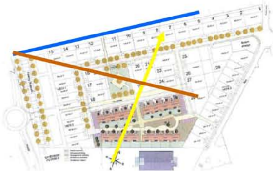
Analyse critique du projet initial